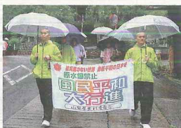
若い僧侶3人が一緒に 門内を行進（7月12 日、身延山久遠寺）

日、那須町夕狩公民館 で福島から引き継がれ スタート。翌30日には さくら市の東輪寺で、 20回目となる「広島原 爆の残り火」の分灯式 がおこなわれました。