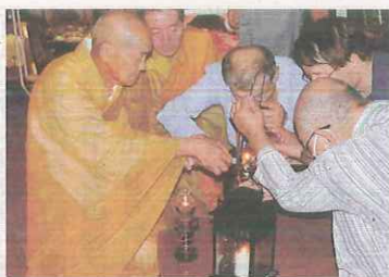
「広島原爆の残り火」 分灯式（6月30日、さ くら市東輪寺）