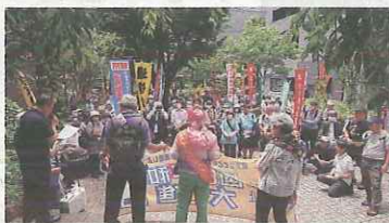
滋賀県から京都府への 引き継ぎ集会（6月21 日、山科ラクト公園）

京都では、6月21日 に滋賀から引き継いで 行進スタート。202 0年から4年間、コロ ナ感染対策のため行進 コースはショートカッ トでおこなってしまし たが、今年からフルコ ースに完全復活。約8 キロの道程を、2時間 30分かけてしっかりと 歩き、沿道、道行く人 に平和と核兵器廃絶を 訴えました。コースの 途中、生活協同組合の みなさんも合流し、行